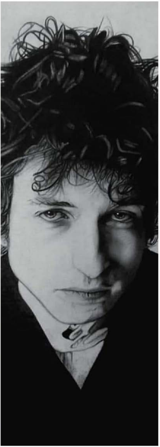
People by Laurent Gourbeau